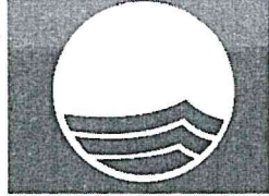
Bandiera Blu 2021