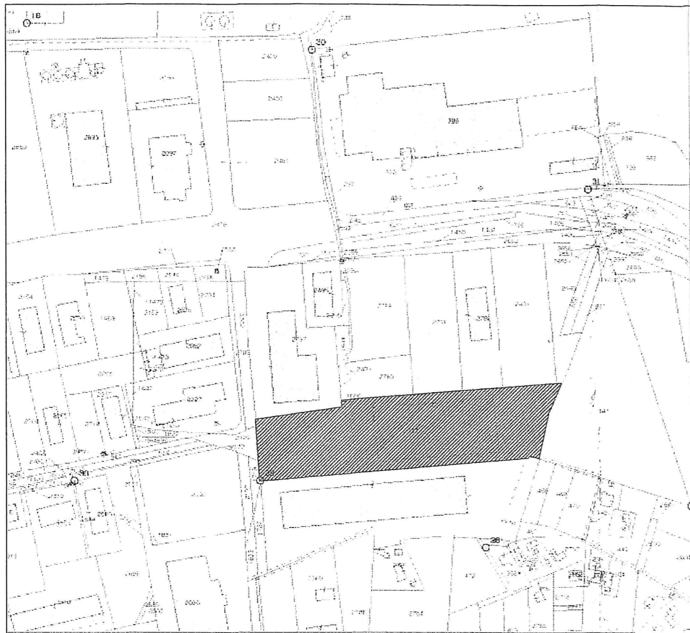
ESTRATTO DI MAPPA FOGLIO 169 P.LLA 389 SCALA 1:4.000